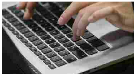
Fondazione CDP e Develhope sostengono la formazione digitale nel Sud Italia